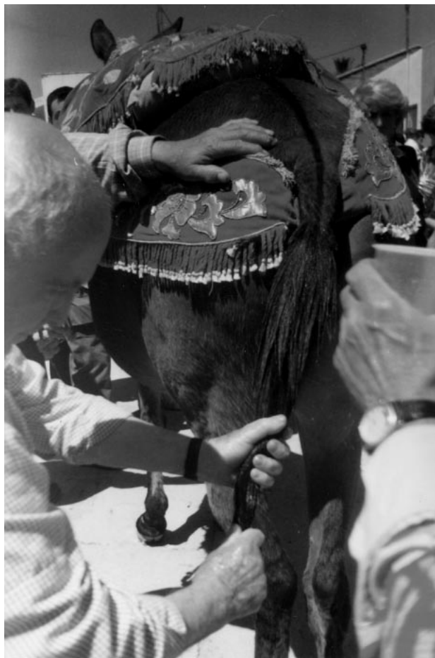
Cruz de Arriba. Peinado y adornado del rabo de las bestias (2001)

A las once de la mañana comienza en la Cruz de Arriba, a las doce en la de Abajo, la llamada “Llevada de los Viejos”, es decir, el traslado de los hermanos de más edad a los lugares establecidos para confeccionar los haces de romero que habrán de cargar en las bestias,