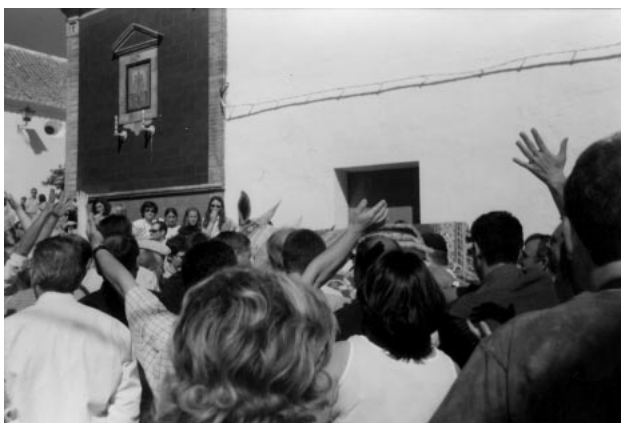
Cruz de Abajo. Recibimiento de las bestias (2000)

Los rabos de los mulos, las bestias en Berrocal, ásperos de por sí, se trenzan y se suavizan echándoles... ¡vino!, porque "...es fiesta y alegría y el vino representa la alegría...", nos comentan. Luego se recubren de tela del mismo color que los hatos. Los mulos están preparados para el recibimiento general. Las bestias son aclamadas y vitoreadas por los hermanos de forma indescriptible, continuamente con los brazos en alto. Resulta, ciertamente, un espectáculo impresionante, pleno de color y alegría, en tanto que la banda de música toca incansable los sonos de las coplas del romero.